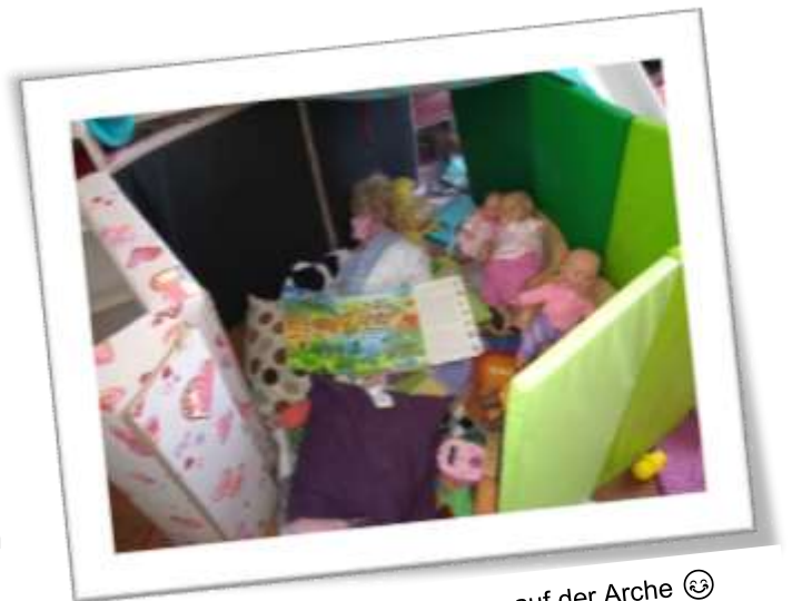
Ganz schönes Chaos auf der Arche 😊